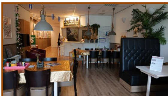
De Oase in rust

Lieve nieuwsbrieflezers, willen jullie meebidden om een vruchtbare bodem voor het Goede Nieuws van God in het leven van mijn collega appelplukker uit het Gooi?