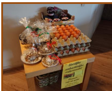
Verkoop eieren en vogelvoerborstjes