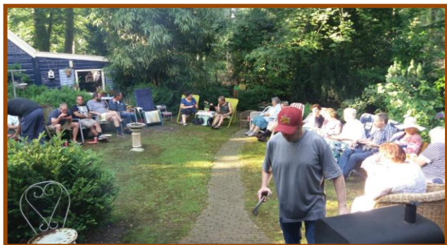
Foto's van de BBQ